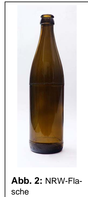
Abb. 2: NRW-Flasche

Die dritte Form des Mehrweggebildes ist das sog. „Poolgebilde“, bei dem gemäß ausdrücklicher Betonung durch den BFH das zivilrechtliche Eigentum an