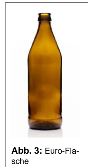
Abb. 3: Euro-Flasche