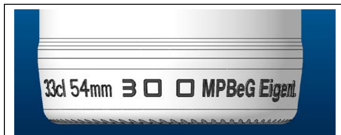
Abb. 1: Beispielhafte Markierung eines individualisierten Einheitsgebindes

Grundvoraussetzung der Poolung bisheriger standardisierter Einheitsgebinde ist deren durchgängige klare Kennzeichnung, die das Gebinde als im Gemeinschaftseigentum des geschlossenen Kreises der Poolteilnehmer befindlich ausweist und eine eindeutige, händisch wie maschinell leicht erfassbare Unterscheidung vom formgleichen Einheitsgebinde ermöglicht. Dies