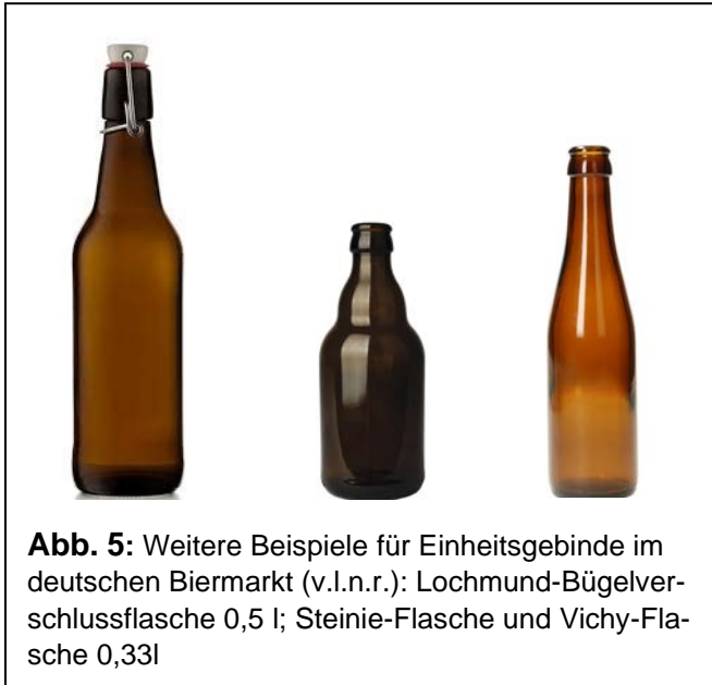
Abb. 5: Weitere Beispiele für Einheitsgebinde im deutschen Biermarkt (v.l.n.r.): Lochmund-Bügelverschlussflasche 0,5 l; Steinie-Flasche und Vichy-Flasche 0,33l

der Poolflasche durch die Übergabe auf den einzelnen Handelsstufen ebenfalls nicht wechselt: Der Kreis der berechtigten Nutzer ist beschränkt, jedem von ihnen ist z. B. auf der Grundlage eines konkreten, die Teilnahme am jeweiligen Pool regelnden Vertragswerkes ein definierter Anteil am Leergutbestand als Miteigentümer zuzurechnen. Das bekannteste Beispiel für dieses „individualisierten Einheitsleerguts“ ist die „Brunnenflasche“ – auch „Perlflasche“ genannt - der Genossenschaft Deutscher Brunnen 18 .