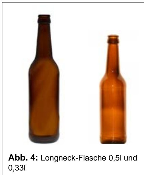
Abb. 4: Longneck-Flasche 0,5l und 0,33l

Es handelt sich hier wie auch bei weiteren, weniger verbreiteten Mehrweggebindetypen (s. Abb. 5, S. 13) um Standardflaschen, an denen die einzelnen Nutzer gem. o.g. BGH-Urteil kein konkretisierbares Miteigentum haben.